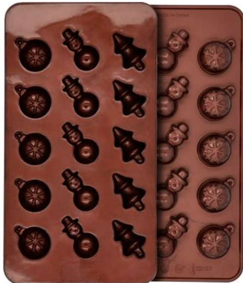
Silicone praline moulds "Christmas"