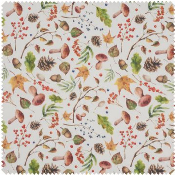
Motiv-Stoff Leinenoptik "Herbstzauber"