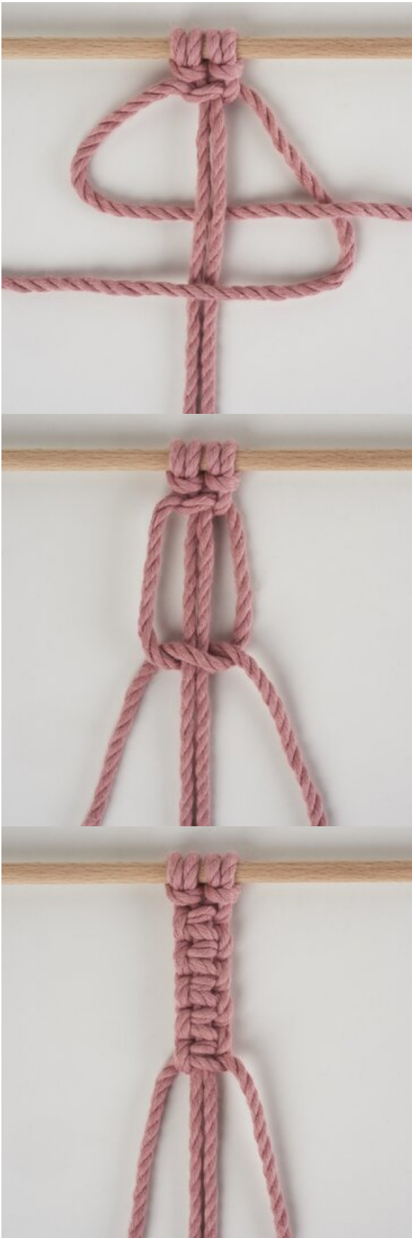
Kreuzknoten - nach rechts gerichtet