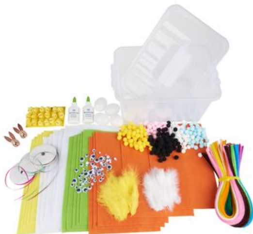
VBS Hobby-Box "Ostern", 586 Teile 24,95 €